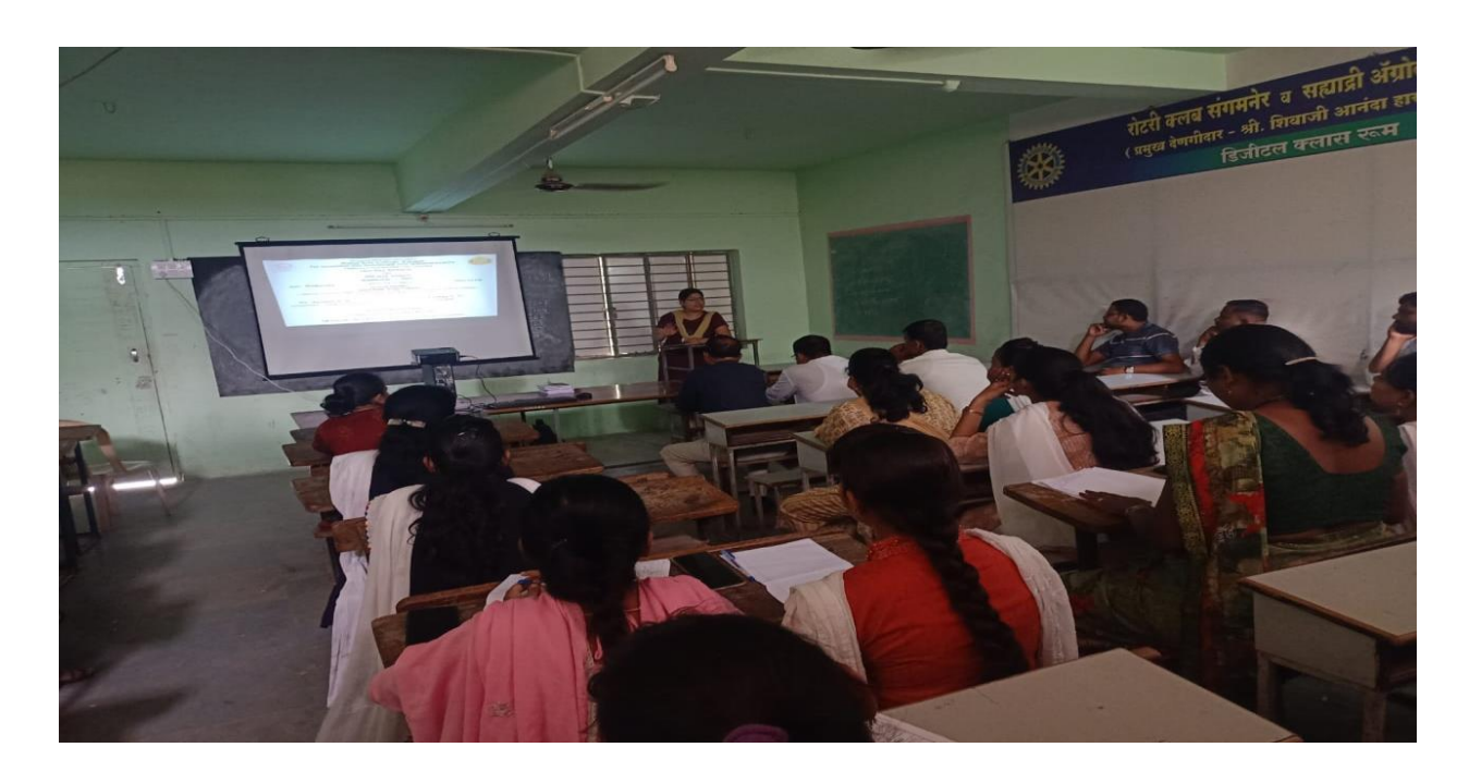
Snap of PRESENTATION OF IPR AND PETANT.